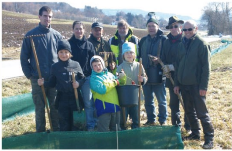
2013 Erster Einsatz des neuen Amphibienschutzzaunes

Am 05. Mai 1983 wurde die Ortsgruppe Ebermannstadt gegründet. Die Motive von damals sind auch heute noch entscheidend für die vielen engagierten Mitglieder: Sie bewahren Natur und Schönheit der Heimat und übernehmen Verantwortung für einen schonenden Umgang mit der Schöpfung in einer global vernetzten Welt.