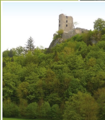
Im Land der Burgen, Mühlen und Höhlen hat der Naturschutz weiterhin eine Zukunft