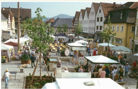
1997 Ökomarktfest Marktplatz Ebermannstadt

Im Rahmen unseres sehr beliebten und erfolgreichen Kinderprogrammes investieren wir vor dem Hintergrund einer alternativen Mitgliederstruktur sowohl in den verantwortungsvollen Umgang mit unseren natürlichen Lebensgrundlagen, als auch in die Zukunft unserer Ortsgruppe.