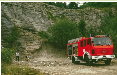
1994 Mit Unterstützung der Freiwilligen Feuerwehr Ebermannstadt werden im heißen Sommer die Laichtümpel der Gelbbauchunke im Steinbruch vor Austrocknung gerettet