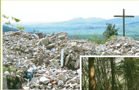
1992 Bauschuttablagerungen auf dem Gelände des Steinbruchs