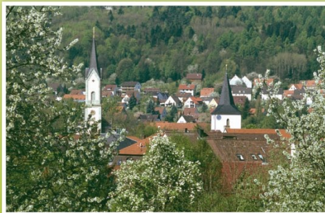
1983 Ebermannstadt im Frühling – eine Stadt im Grünen

Im Rahmen unseres sehr beliebten und erfolgreichen Kinderprogrammes investieren wir vor dem Hintergrund einer alternativen Mitgliederstruktur sowohl in den verantwortungsvollen Umgang mit unseren natürlichen Lebensgrundlagen, als auch in die Zukunft unserer Ortsgruppe.