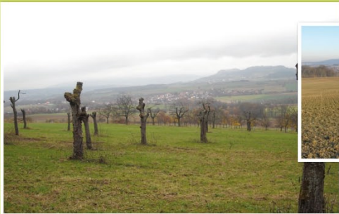
Lebensraumverlust durch Umpflügen von Grünflächen und Roden von Streuobstwiesen.