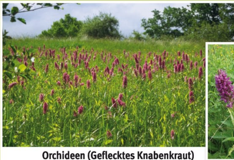
Orchideen (Geflecktes Knabenkraut) im Kalkflachmoor Steingraben.