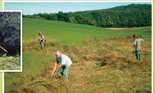
Pflege des Kalkflachmoors Steingraben durch Mitglieder der Ortsgruppe.